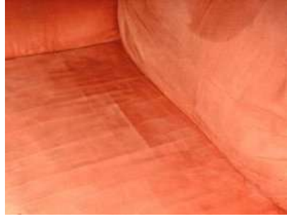
No debería esperar tanto tiempo antes de la primera limpieza