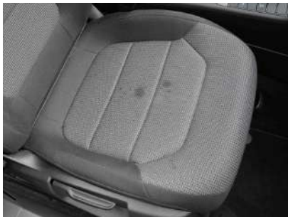
Manchas en textil

En caso de manchas y suciedad, utilice el Limpiador para Textil y Alcántara COLOURLOCK . Se utiliza para la limpieza de textiles de alta calidad como muebles tapizados y alfombras, para la limpieza de superficies y la eliminación de manchas en textiles delicados, Alcántara, fibras sintéticas y naturales.