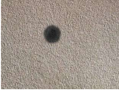
Los quemazos en alcántara, no se pueden reparar fácilmente