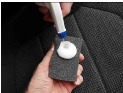
En caso de manchas, rocíe el limpiador textil sobre una esponja y haga espuma con la mano