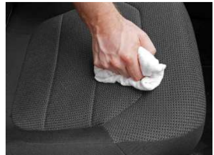
Frotar con paño de rizo