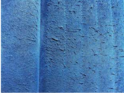
Alcántara bastante quemado