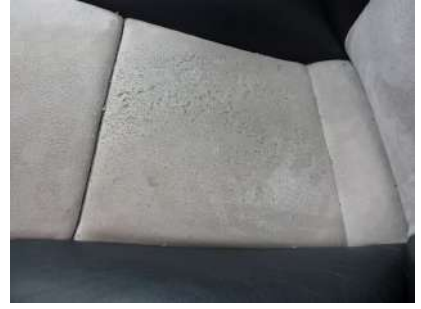
Pocas "pelotillas", se pueden mejorar la Esponja-lija