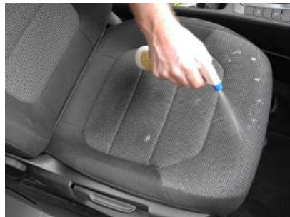
Pulverizar la zona