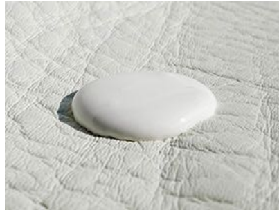
El Protector Especial Cuero COLOURLOCK protege el cuero nuevo de desgaste