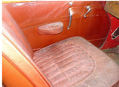
Un vehículo encontrado en un garaje es ideal para el Limpiador Cuero Fuerte COLOURLOCK