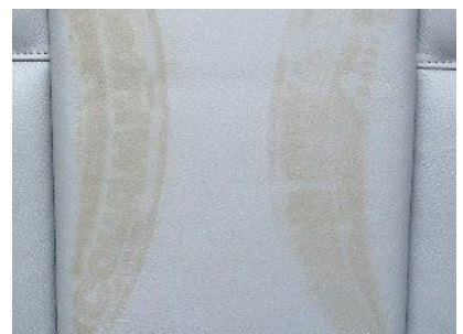
Marcas de neumáticos, no se pueden limpiar. Solo un profesional