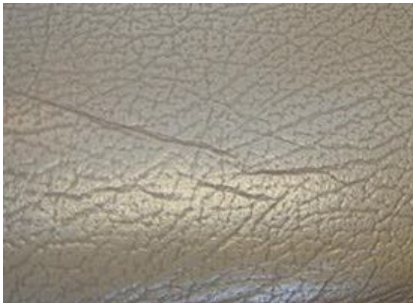
El Cepillo para Cuero COLOURLOCK es una ayuda para la suciedad incrustada en la piel