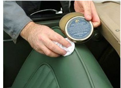
La Cera Protectora Cuero "Elephant" COLOURLOCK protege e impermeabiliza el cuero de los descapotables