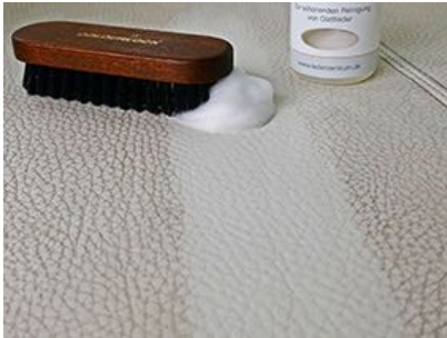
Dependiendo de la suciedad, limpie el cuero con Limpiador Cuero Suave o Fuerte COLOURLOCK

Para abrasiones y arañazos menores, es posible renovar el color con nuestro Tinte Reparador Cuero COLOURLOCK . Por favor, tenga en cuenta nuestros textos de información detallada.