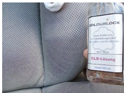
En manchas de prendas, muchas veces el Limpiador, no es suficiente