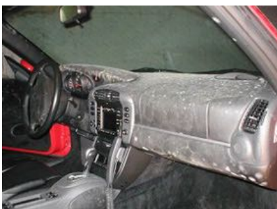
Por favor, tenga en cuenta el Manual para cueros con moho