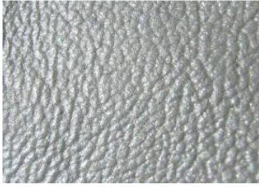
Cuero metálico de Porsche. El más común es blanco "perla"