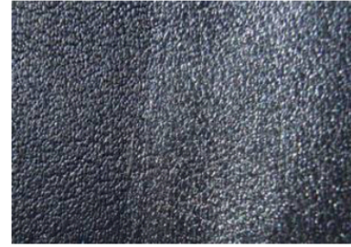
Cuero "Azul metálico" de Volvo