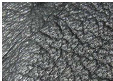
Gris oscuro de Porsche