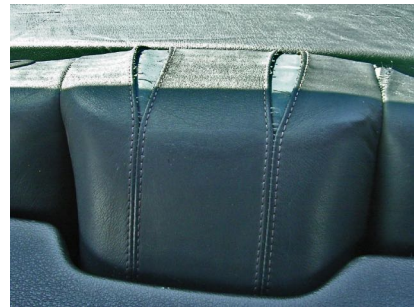
El cuero negro se calienta más fácil al sol. Este cuero debe ser reemplazado.