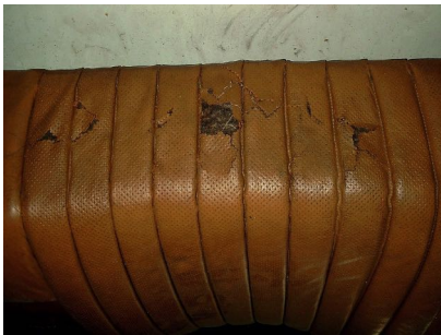
Daño producido por el sol, el cuero fue raramente tratado con productos de cuidado y re engrasado.

Dependiendo del uso, se debe aplicar un tratamiento de mantenimiento una o dos veces al año. Otros tratamientos con Aceite Ablandador Cuero no son necesarios.