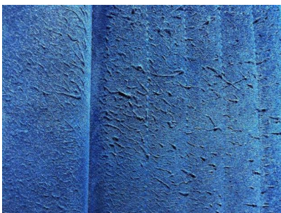
Alcántara bastante quemado