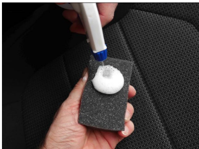
En caso de manchas, rocíe el limpiador textil sobre una esponja y haga espuma.