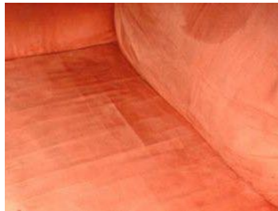
¡No deberías esperar tanto tiempo antes de la primera limpieza!