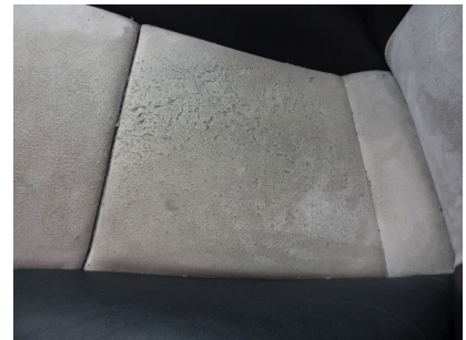
Pocas "pelotillas", se pueden mejorar