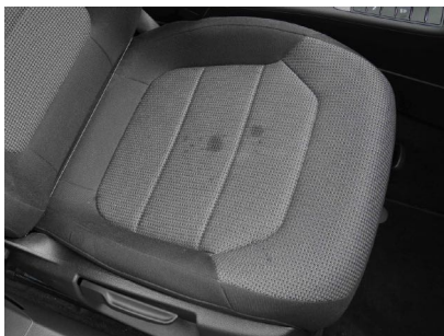
Manchas en textil

Tejidos como Alcántara y Amaretta son materiales de microfibra (materiales sintéticos) que tienen una superficie similar al ante (gamuza). Tanto su aspecto visual como el tacto, recuerdan al ante. Este tipo de textiles y telas delicadas, deben ser cuidados periódicamente pasándoles el aspirador y ocasionalmente con un paño húmedo. En caso de manchas y suciedad normal, utilice Limpiador Textil y Alcántara COLOURLOCK . Se utiliza para la limpieza de textiles de alta calidad como muebles tapizados y alfombras, para la limpieza de superficies y la eliminación de manchas de textiles delicados, Alcántara, fibras sintéticas y naturales.