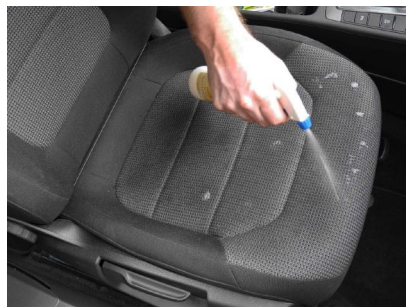
Pulverizar la zona