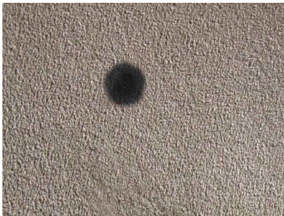
Los quemazos en alcántara, no se pueden reparar fácilmente

El Alcántara es propenso a las "pelotillas". La abrasión hace que las fibras se conviertan en pequeños nudos esféricos. Si la superficie no está demasiado dañada, puede restaurarse con la Esponja-lija para cuero COLOURLOCK (ver vídeo). En caso de que el material esté demasiado dañado, debe ser reemplazado.