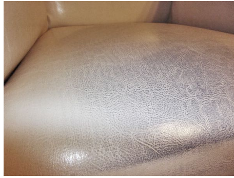
Fuerte decoloración en muebles de cuero