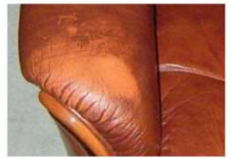
Patina con tono marrón