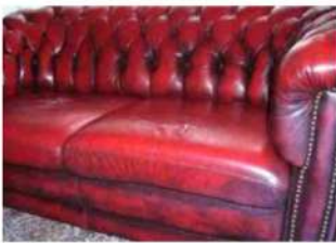
Pátina típica de los cueros Chester

Los cueros antiguos que ya han sufrido la abrasión del color deben ser tratados con nuestro Protector Especial Cuero COLORLOCK . El Protector Especial fija la superficie y reduce la abrasión del color. Para nutrir y conservar el cuero antiguo y seco, use nuestro Protector para Cuero COLORLOCK , es el producto ideal de cuidado de cuero. Para cuero brillante, se recomienda nuestra Cera Protectora Cuero "Elephant" COLORLOCK . Contiene aceites y antioxidantes que previenen los efectos del envejecimiento. Mantiene el cuero suave y flexible y previene el crecimiento de moho. Muy adecuado para los sofás Chesterfield y artículos de cuero antiguos.