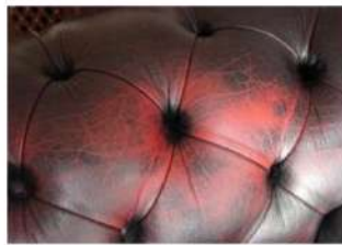
Pátina desgastada en la zona de la cabeza