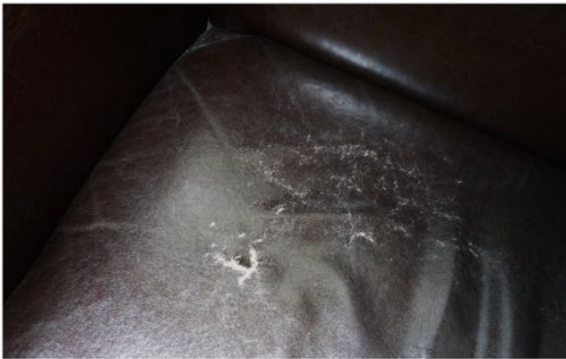
Agrietado y frágil