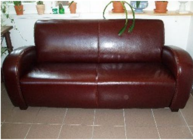
Sofá de cuero PU nuevo