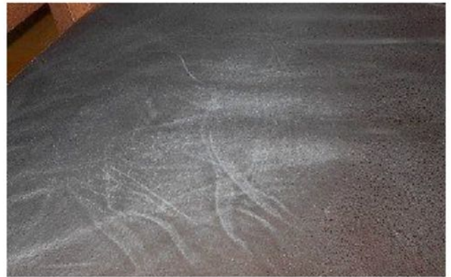
Área de contacto con piel/cabello, mate y pegajosa