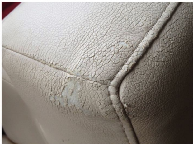
La superficie se está desprendiendo de forma gradual. No es posible repararlo.

Los cueros sintéticos ser protegidos con el Protector para Vinilo, Skay, Polipiel COLOURLOCK . Este producto sella las superficies reduciendo la suciedad y la fragilidad. Otra de las ventajas del protector es que la superficie no queda brillante, sino con su aspecto original. Aplique el protector con un paño suave, en capas finas y de manera uniforme.