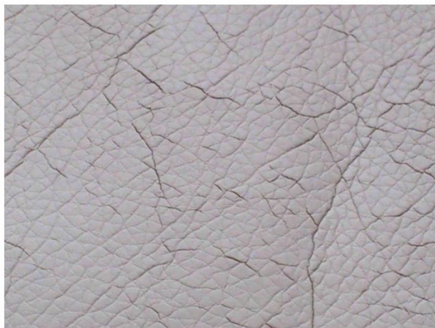
Las roturas atraviesan la zona de carga. No es posible repararlo.