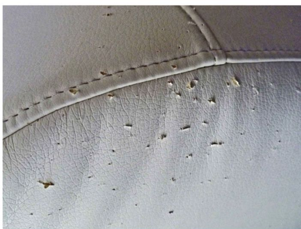
Arañazos de gato: la solución de emergencia es pegar con paciencia las fibras que sobresalen.