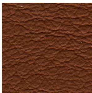
CITROËN ALEZAN FUCHSBRAUN

Por regla general, todas las pieles negras corresponden al color F034 de nuestra carta de colores estándar y están disponibles sin cargo adicional.