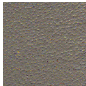
FORD LIGHT STONE