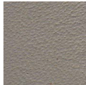
FORD Light Stone

Importante: Los colores que se ven en pantalla son siempre aproximados.