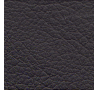
LEXUS SPACE GRAY