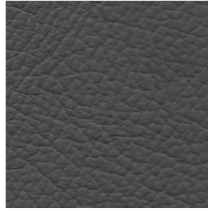
LEXUS GRAY/ GREY