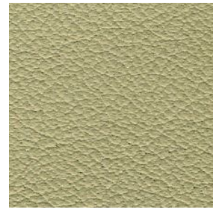
MAYBACH PERLE DUNKEL