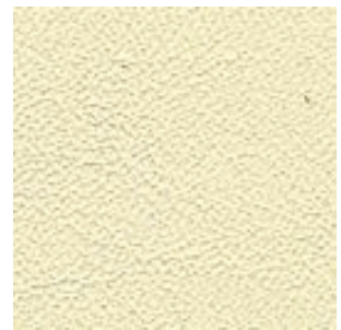
SAAB Light Neutral