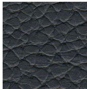
SAAB Grau/Grey/Slate Grey