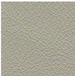
SAAB Beige/Parchment/ Sportbeige