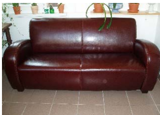
Canapé con cuero PU nuevo.

SE COMERCIALIZA CON DIFERENTES NOMBRES, COMO "CUERO BYCAST", "CUERO PU" O "CUERO PULL UP". EN LAS IMÁGENES QUE VEMOS A CONTINUACIÓN PODEMOS RECONOCER ESTE TIPO DE CUERO. ES CORTEZA DE PIEL DE VACA MARCADA Y TINTADA EN LA SUPERFICIE. LA SUPERFICIE DE CUERO E IMITACIÓN DE CUERO ESTÁ GENERALMENTE CUBIERTA DE UN 100% DE POLIURETANO.