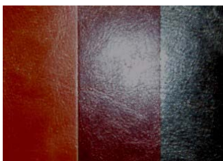
Típicos colores en cuero PU.

La ventaja de este tipo de cuero es su precio. La corteza de cuero se compra a precios muy económicos, pero no son precisamente muy duraderos. Con la capa de poliuretano, el cuero consigue la estabilidad necesaria, pero como contrapartida, el cuero no puede respirar. Los cueros con este tipo de terminación son más fríos y se pegan más que los cueros que no han sido tratados con este tipo de productos.