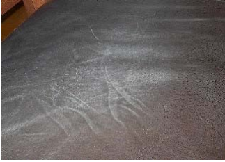
Marcas grasas y pegajosas.