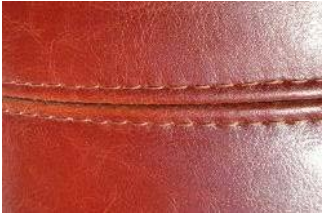
Apariencia típica en cuero PU.