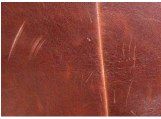
Arañazos y marcas en el cuero.