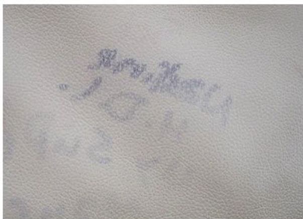
Estampado de tinta sobre cuero