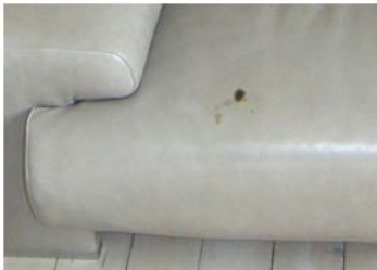
Mancha nueva de aceite en la superficie