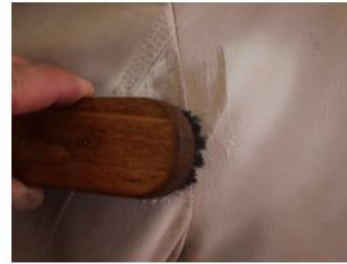
Cepille o aspire con cuidado