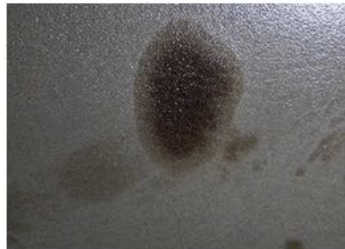
Mancha de cerca