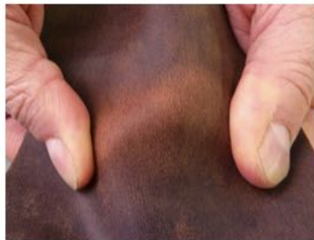
Las áreas oscuras pueden aclararse con estiramientos o las áreas claras pueden oscurecerse con productos de cuidado poco dosificados.