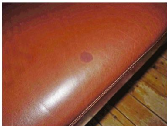
Manchas recientes: Buena posibilidad de eliminarlo con el spray

Si el Absorbe-Grasa Cuero en spray COLOURLOCK no resuelve el problema, por favor consúltenos.