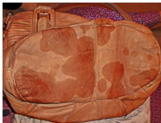
Crema derramada en un bolso: Sólo una empresa de limpieza en seco puede ayudar