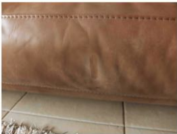
A menudo queda una ligera sombra, puede mejorarse con medios sencillos