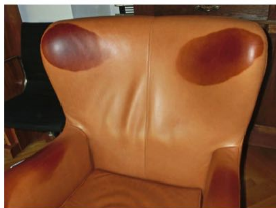
Intento de limpieza incorrecto: Sólo un especialista puede ayudar