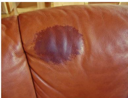
Grasa capilar durante muchos años, además de daños en el color. Sólo un especialista puede ayudar