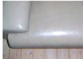
Después de la limpieza con Absorbe-Grasa cuero COLOURLOCK