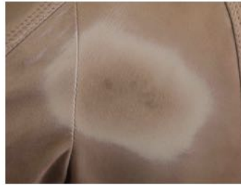
Aplicación del spray Absorbe-grasa