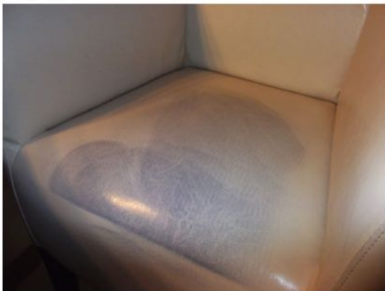
Fuerte decoloración en cuero sintético de una butaca

En casos extremos, se debe identificar el objeto que ha causado el problema. Frote las superficies sospechosas con un paño suave y húmedo y compruebe si hay decoloración. Estos objetos no deben entrar en contacto con las superficies afectadas en el futuro.