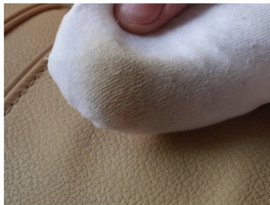
El Disolvente para Cuero GLD puede disolver el color