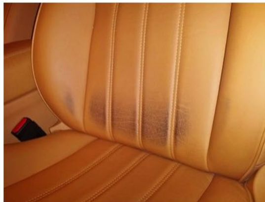
Decoloración del cinturón en cuero de vehículo