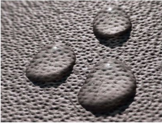
Las impermeabilizaciones protegen contra las manchas y la humedad