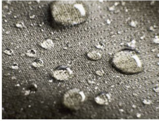
La precaución y el manejo cuidadoso son igual de importantes