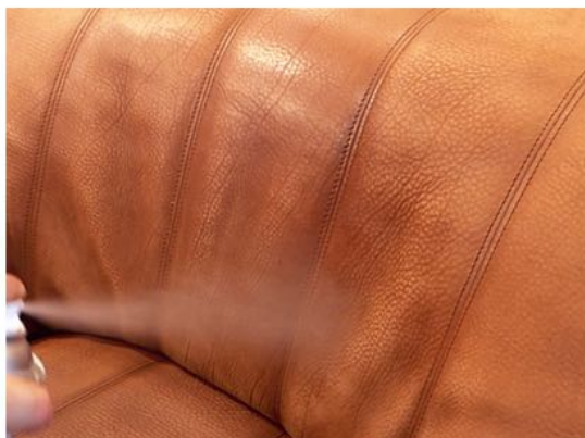
El Protector Anilina cuida el ante viejo y seco

Los materiales de poros gruesos o las superficies altamente absorbentes requieren mayores cantidades de impermeabilización que los materiales de poros finos o materiales con alguna protección todavía presente.