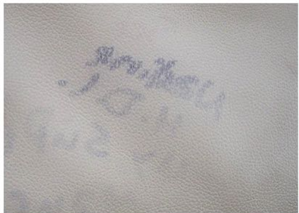
Estampado de tinta sobre cuero