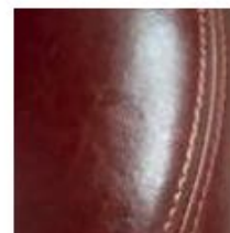
Piel o Cuero PU