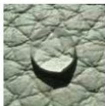
Piel o Cuero Pigmentado

Piel o Cuero PU: La piel PU, también conocido como cuero Bicast, cuero Bycast es un cuero partido (ante) con una película granulada de poliuretano en la superficie. Este tipo de cuero suele ser brillante y de aspecto plastificado.