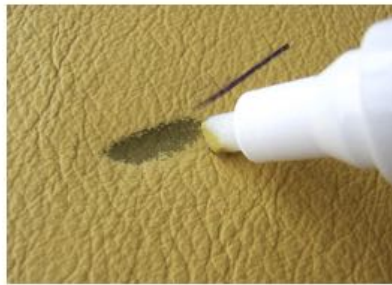
Con trazos más antiguos, se puede eliminar el color del cuero