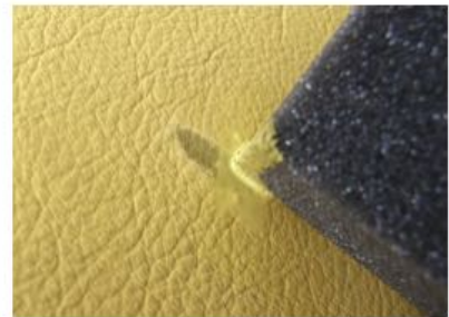
Estas zonas, deben ajustarse con Tinte Reparador Cuero