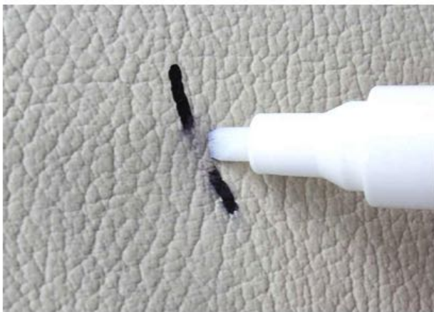
Bolígrafo permanente sobre cuero

El procedimiento es el mismo que para las marcas de bolígrafo, pero los rotuladores permanentes son más difíciles de quitar y penetran en el material más rápidamente. Para marcas sencillas, el Rotulador Quita Tinta es la elección correcta. Para las marcas manchadas por rotulador, utilice Disolvente para Cuero GLD COLOURLOCK . Cubra cualquier resto del rastro con Tinte Reparador Cuero COLOURLOCK y luego aplique el Protector Especial Cuero COLOURLOCK .